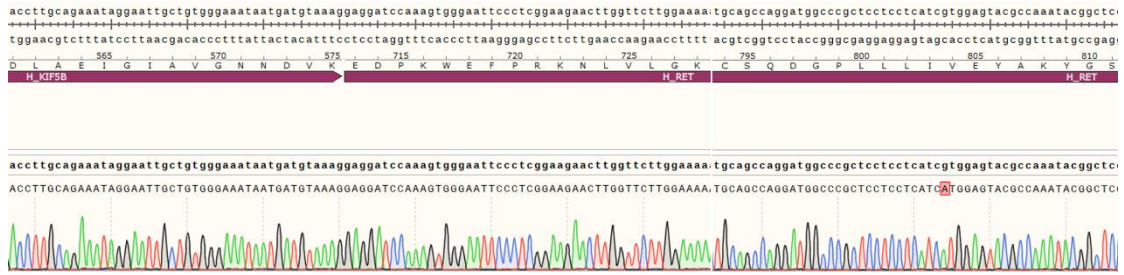
Fig 2. H_KIF5B-RET(V804M) BaF3 Cell Line 测序结果